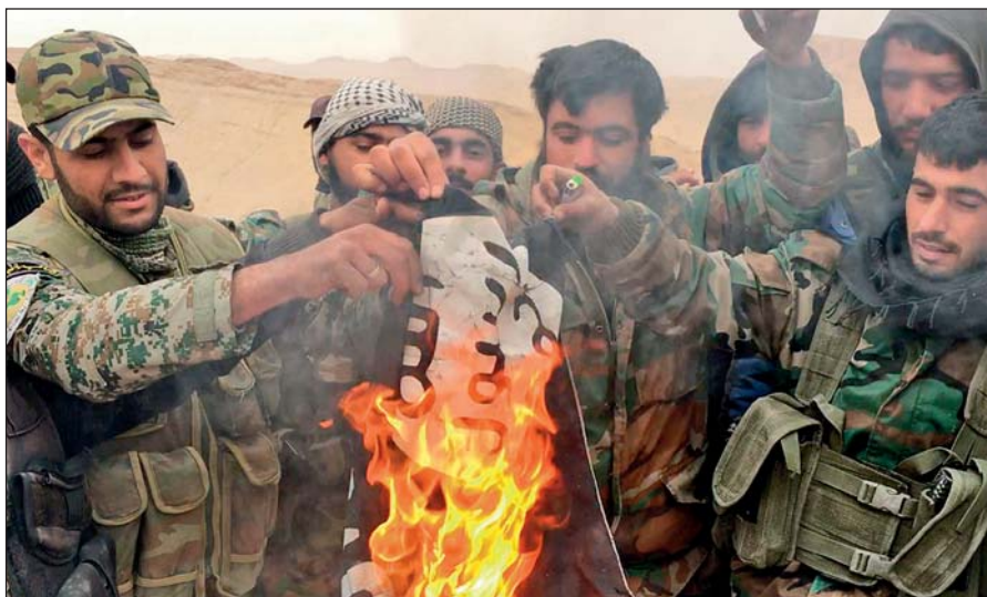
Народные ополченцы САР сжигают флаг ИГИЛ, снятый с отбитой у боевиков цитадели Пальмира.

Современное государство обязано защищать интересы каждого своего гражданина вне зависимости от его расы, национальности, принадлежности к определенной конфессии или религиозной традиции, в то время как ИГИЛ выражает интересы небольшой группы религиозных радикалов, жестоко подавляя остальную часть населения посредством запугивания, насилия и террора.