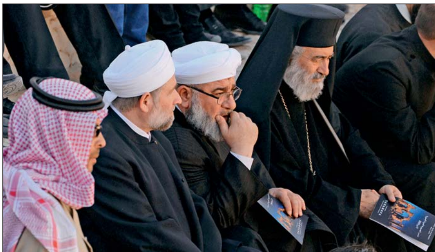
Представители различных конфессий объединились против ИГИЛ. На концерте симфонического оркестра петербургского Мариинского театра в Римском амфитеатре сирийской Пальмиры, освобожденной от террористов ИГИЛ.

В последнее время появилось значительное число верующих, причисляющих себя к крайним религиозным течениям (в СМИ упоминаются как «салафиты», «хариджиты», «ваххабиты»). Однако костяк ИГИЛ составляют лишь люди, причисляющие себя к ультрарадикальному крылу вышеназванных течений.