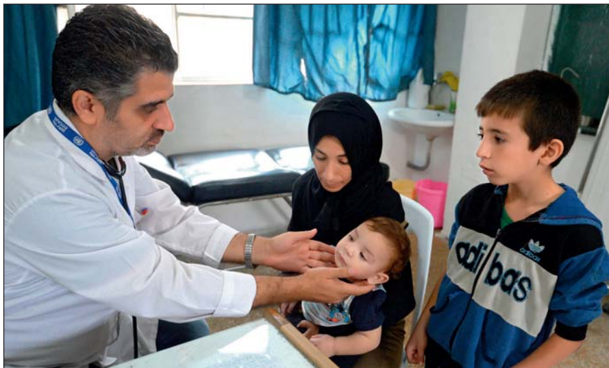
Истинный ислам призывает к состраданию и милосердию. Врач осматривает ребенка в медицинском пункте лагеря при одной из школ Дамаска.

Радикалы объявляют «врагами ислама» всех несогласных с ними мусульман. Ультрарадикальные группировки признают террор и насилие единственным способом достижения провозглашенных ими целей.