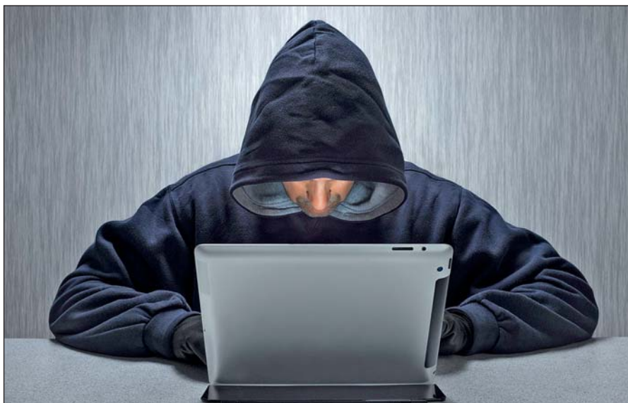
Вербовщики ИГИЛ активно используют Интернет.

Террористы день ото дня совершенствуют методы вербовки новых сторонников, а также алгоритмы их идеологической обработки. Читателю стоит помнить, что те типовые ситуации, которые описаны в данном пособии, можно рассматривать лишь в качестве базовых ориентиров,