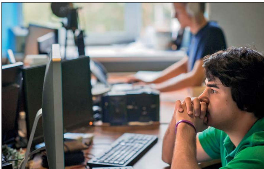
Постоянное присутствие вербовщиков ИГИЛ в соцсетях.

Активисты ИГИЛ поддерживают свои аккаунты в сетях Facebook, Twitter, Instagram, Friendica, Telegram. Активно они заявили о себе и в российских социальных сетях: «ВКонтакте» и «Одноклассниках».