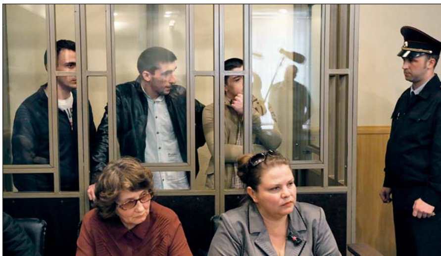
В Российской Федерации предусмотрена административная и уголовная ответственность за пропаганду идей терроризма, участие в деятельности террористических организаций.