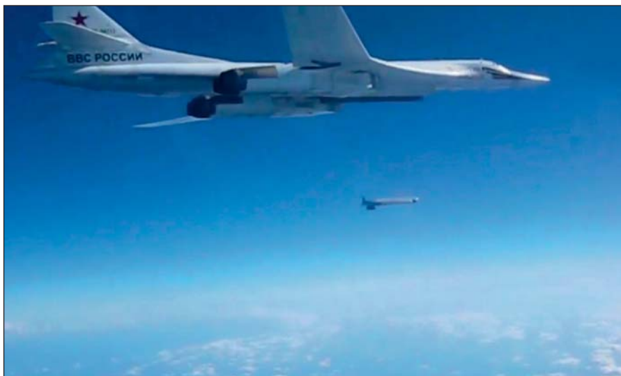
Воздушная операция российских ВКС по уничтожению боевиков ИГИЛ в Сирии.