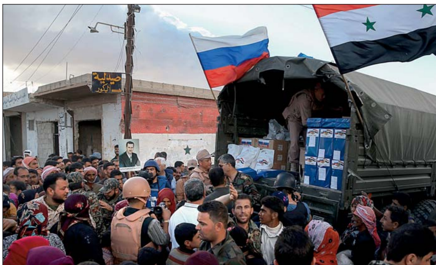
Россия оказывает гуманитарную помощь Сирии.