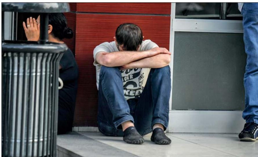
Наиболее уязвимы для вербовки одинокие люди, находящиеся в сложной жизненной ситуации.