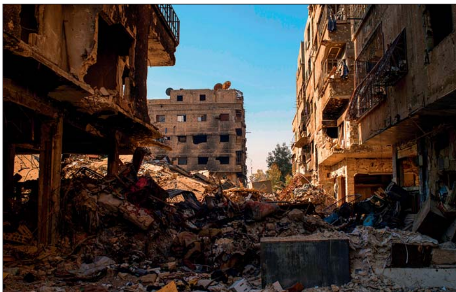
Разрушенный боевиками ИГИЛ Дамаск.

Террористы поставили на поток производство видеороликов с жестокими сценами казней пленников, заложников и «вероотступников». Эти материалы потом широко распространяются в социальных сетях и