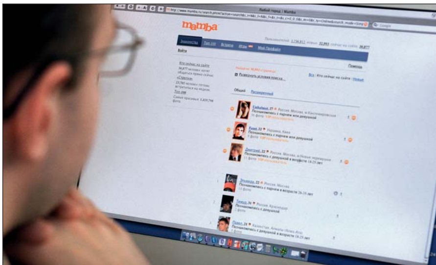
Сайты знакомств, чаты поклонников компьютерных игр, форумы футбольных болельщиков — отдельная группа риска.