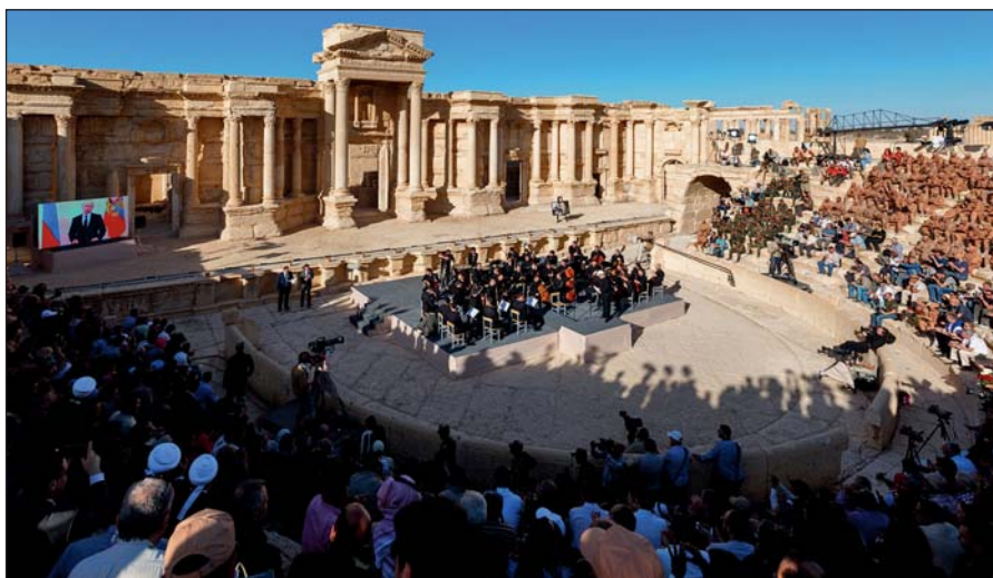
Освобожденная Пальмира. На концерте симфонического оркестра петербургского Мариинского театра под руководством народного артиста России Валерия Гергиева в Римском амфитреатре сирийской Пальмиры, освобожденной от террористов ИГИЛ.